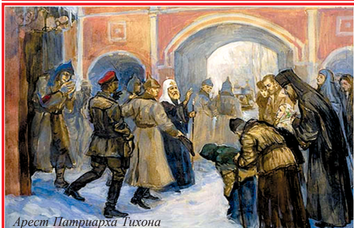
Арест Патриарха Тихона